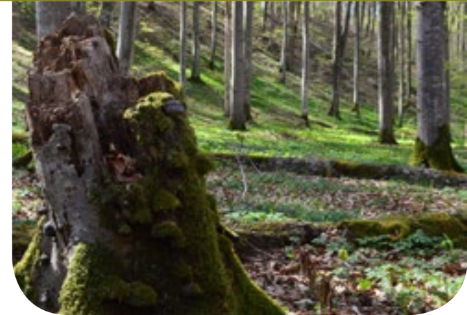
■ Am Nordrand der Endmoräne wachsen dichte Buchenwälder.