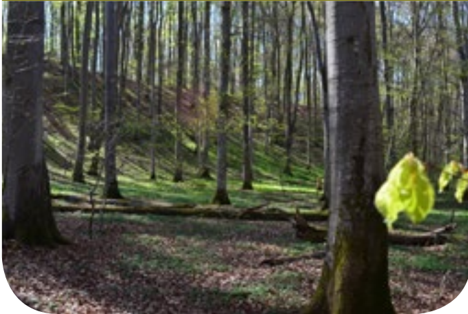
■ Flache Terrassen und steile Wälle der Endmoräne prägen das Landschaftsbild im Naturwaldreservat.