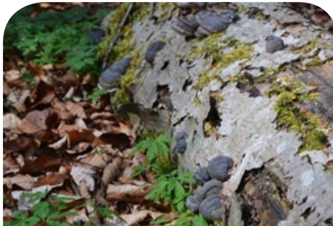
■ Totholz ist ein wichtiges Element naturnaher Wälder.

An den umgefallenen, dicken Buchenstämmen leben seltene Pilzarten wie der Schwarzsamtige Dachpilz und der an einen eingefrorenen Wasserfall erinnernde Ästige Stachelbart.